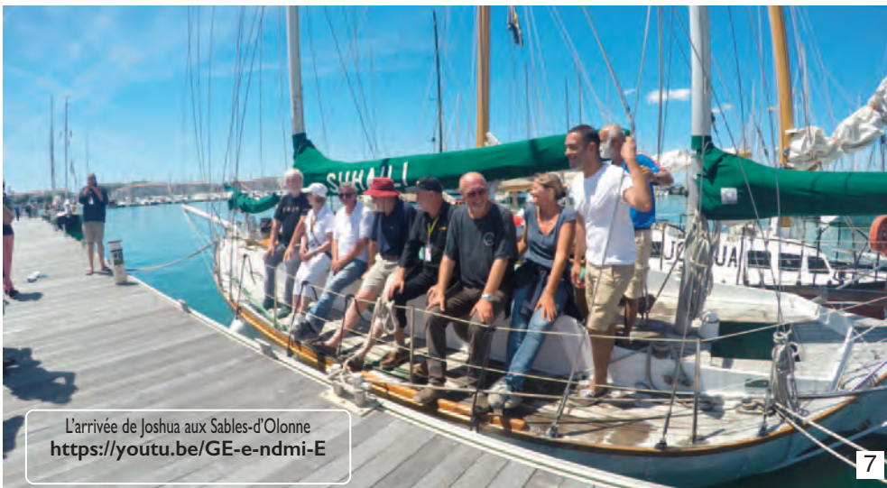
L'arrivée de Joshua aux Sables-d'Olonne https://youtu.be/GE-e-ndmi-E