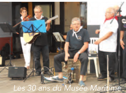
Les 30 ans du Musée Maritime

Pour cette nouvelle saison, les Z'Amis conserveront les chants classiques de marins, les chansons de bord ou de port, mais ajouteront à leur répertoire des chansons traditionnelles, des adaptations de shanties et des chansons de compositeurs et interprètes de variété inspirés par la mer, l'océan, les marins, et les bateaux.