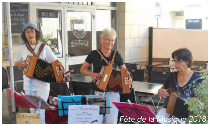
Fête de la Musique 2018

Le répertoire se compose de chants de la mer et de danses régionales traditionnelles. Répétitions le mardi matin de 10 h à 12 h au Carré des Amis.